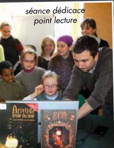
séance dédicace point lecture