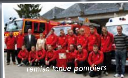
remise tenue pompiers