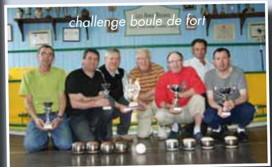
challenge boule de fort