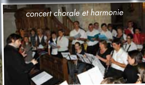
concert chorale et harmonie