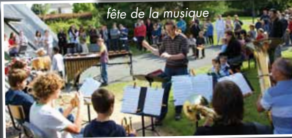
fête de la musique