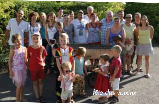
fête des voisins