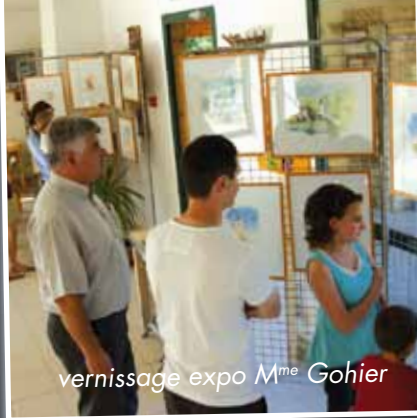
vernissage expo M me Gohier