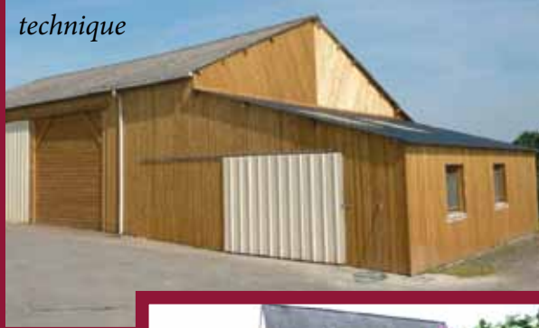
Locaux du service technique

Dans un domaine moins artistique mais tout aussi nécessaire, nous poursuivons l'entretien des voies communales. Cette année plus de 50 000 € seront consacrés pour les routes en dehors du bourg.