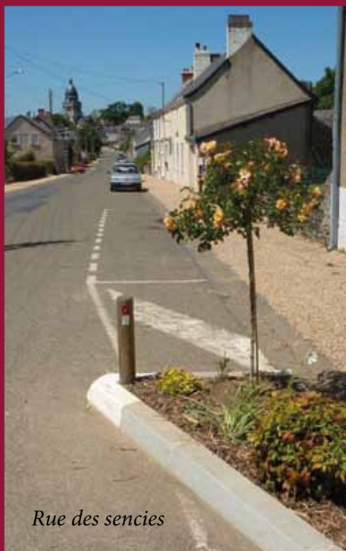
Rue des sencies

Cette réglementation s'applique à tous sans exceptions. Le manquement à la réglementation est passible d'une amende de 75 000 € et de 2 ans d'emprisonnement.