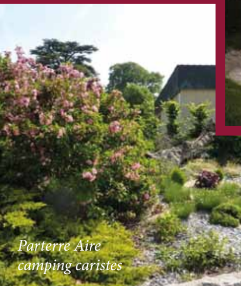
Parterre Aire camping caristes