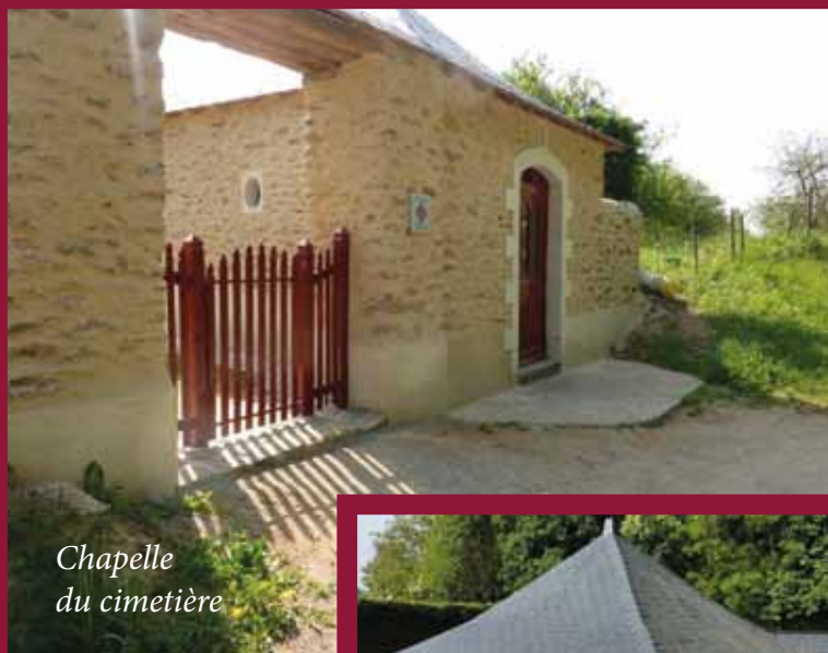
Chapelle du cimetière