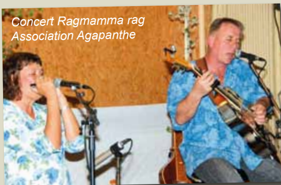
Concert Ragamma rag Association Agapanthe