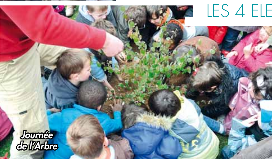
Journée de l'Arbre